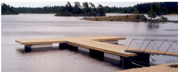
Över: Dalslands Museum, Uppered, Gästbrygga Höger: Sarpsborg SF, Norge