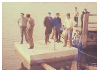
Den första Bävern-pontonerna – tillverkad i Finland 1963 av Tage Strandström & Co.